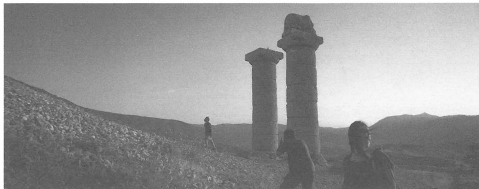
„Сухи треви“, 2023 г., реж. Нури Билге Джейлан

„Сухи треви“, Турция, Франция, Германия, Швеция, 2023 г., реж. Нури Джейлан; „Учителската стая“, Германия, 2023 г., реж. Илкер Чатак