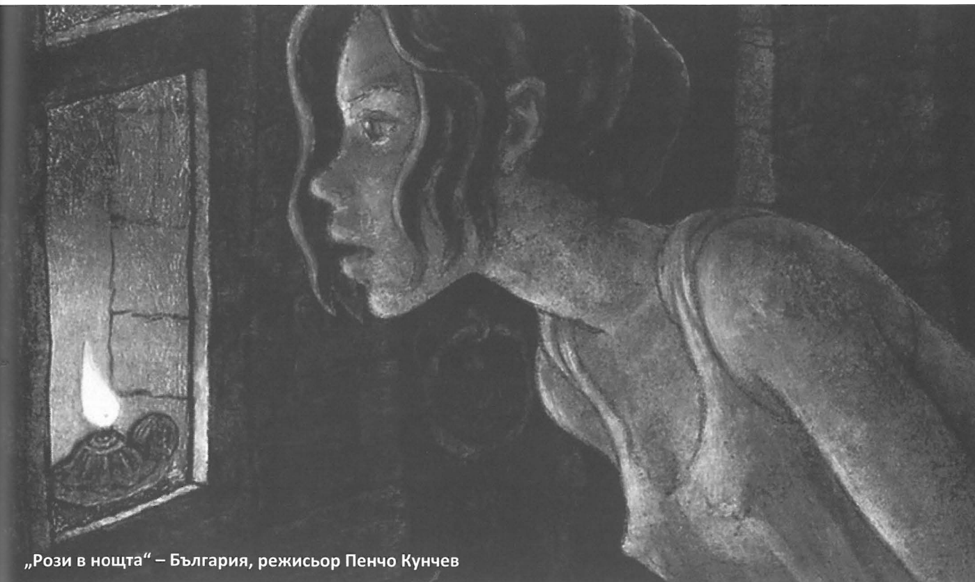
„Рози в нощта“ – България, режисьор Пенчо Кунчев

Освен с филми, програмата на фестивала беше наситена с множество паралелно протичащи събития. Двете зали на конгресния център във Варна бяха постоянно заети, по стълбите непрекъснато сновяха автори, студенти, гости на фестивала. Сред съпътстващите програми не можем да не споменем филмите от „Панорама – най-доброто от света“, програмите с филми на членовете на журито, специална програма от анимационни филми от прочутото сту-