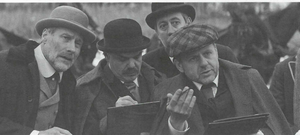
кадър от „Имало една война“, реж. Анри Кулеф

Игрален? Мисля, че не. Има само документални филми и телевизионни предавания по темата за едно от най-великите събития в историята на България. Самото Съединение, този всенароден възход, духът, идеята да се създаде една обединена нация – малко моменти в българската история са били толкова емоционално приповдигнати и така духовно извисени. Какви мъдри, а днес забравени хора са били борците за това Съединение! Ние сме едни безобразници, които си мислят, че животът започва и свършва с тях и че всички поколения преди нас са живеели в пещерите. Нищо по-добро – светлите умове, които са направили велики неща за България, са живеели и творили много преди нас.