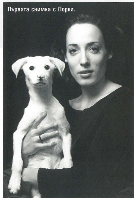
Първата снимка с Порки.