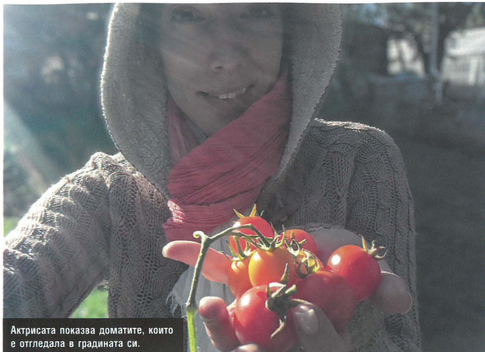
Актрисата показва домати, които е отгледала в градината си.

Аз съм умерен хипохондрик. Пазя се, доколкото мога, научена съм да слу-