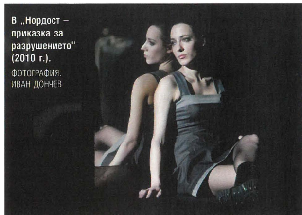
В „Нордост – приказка за разрушението“ (2010 г.).

Не съм самостоятелна жена и не искам да бъда. Имам нужда от човек до себе си. Огромна нужда имам от хора!