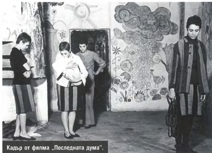
Кадър от филма „Последната дума“.