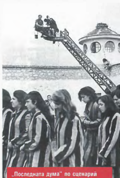
„Последната дума“ по сценарий на Бинка Желязкова е посветен на съдбата на група затворнички-комунистки от килията за смъртни.

„Бинка изпревари времето, защото съвсем естествено се наложи с таланта си, а не, защото е била жена“, обобщава кинокритичката. През последните години европейското кино възроди интереса си към филмите на Бинка Желязкова. Най-старият кинофорум на Балканите – Международният фестивал в Солун – през 2021-ва посвети специална панорама на нейните ленти. Френски кина излъчиха тази пролет „А бяхме млади“ и „Привързаният балон“. А през септември т.г. центърът „Барбикан“ в Лондон също отдава почит на Бинка Желязкова с прожекции на нейни филми. Този интерес показва колко актуални могат да бъдат филмите ѝ и за младото поколение в момента.