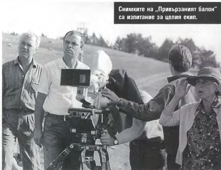
Снимките на „Привързаният балон“ са изпитание за целия екип.