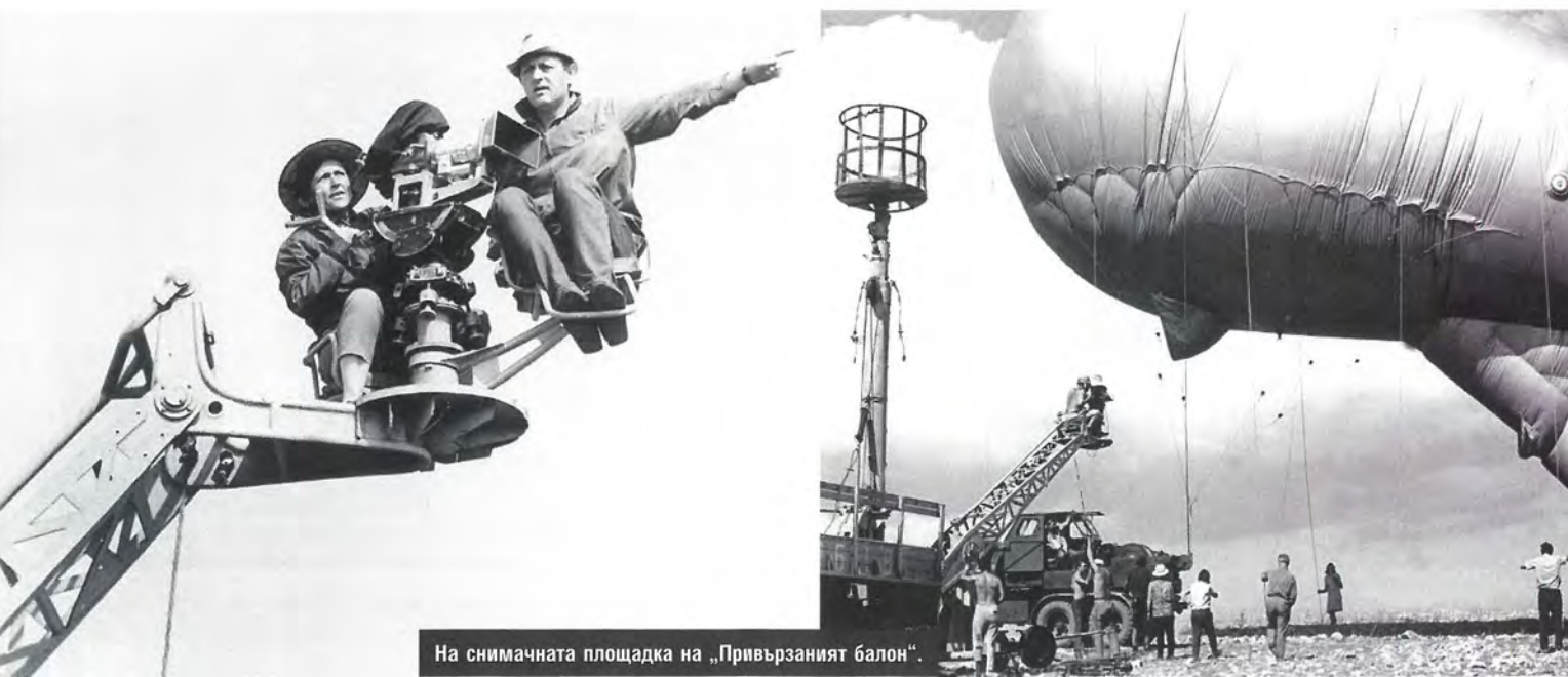
На снимачната площадка на „Привързаният балон“.

„ПРИВЪРЗАНИЯТ БАЛОН“ (1967) е определен от шефовете на киноиндустрията ни като „ГРЕШНО произведение на нашето социалистическо изкуство“, което „окарикутирава българския СЕЛЯНИН“