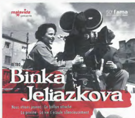
Плакат, посветен на специални прожекции на филми на Бинка Желязкова във Франция.